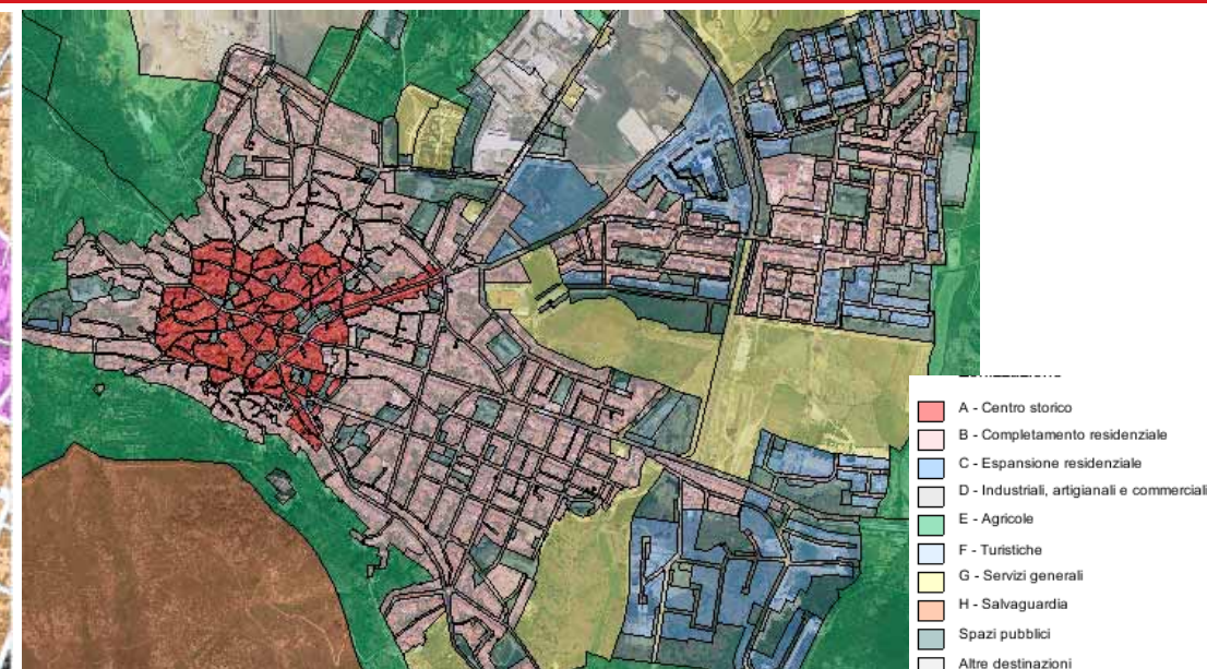
STRUMENTO URBANISTICO VIGENTE – PUC del 2000

Nel PUC del comune di Guspini è presente la zona A. Il Comune di Guspini è dotato di Piano Particolareggiato della la zona A, approvato con Deliberazione del Consiglio Comunale n° 10 del 14/03/2005 ed è dotato di Piano Particolareggiato della zona B1 approvato con Deliberazione del Consiglio Comunale n°29 del 12/05/2004.