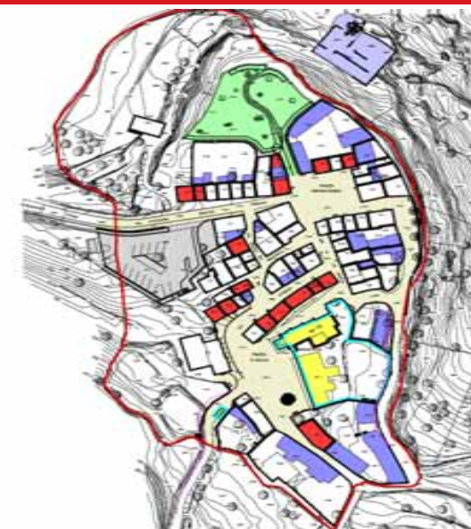
STRUMENTO URBANISTICO VIGENTE – PUC del 2001