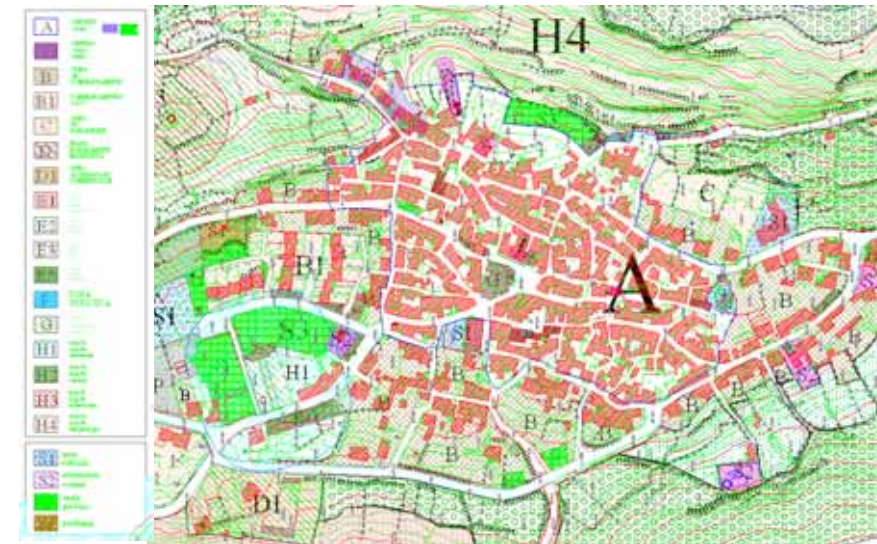
STRUMENTO URBANISTICO VIGENTE – PUC - 1999

Nel PUC del comune di Aidomaggiore è presente la zona A. Il Comune di Aidomaggiore è dotato di Piano Particolareggiato approvato con deliberazione del Consiglio Comunale n° 25 del 27/09/2002