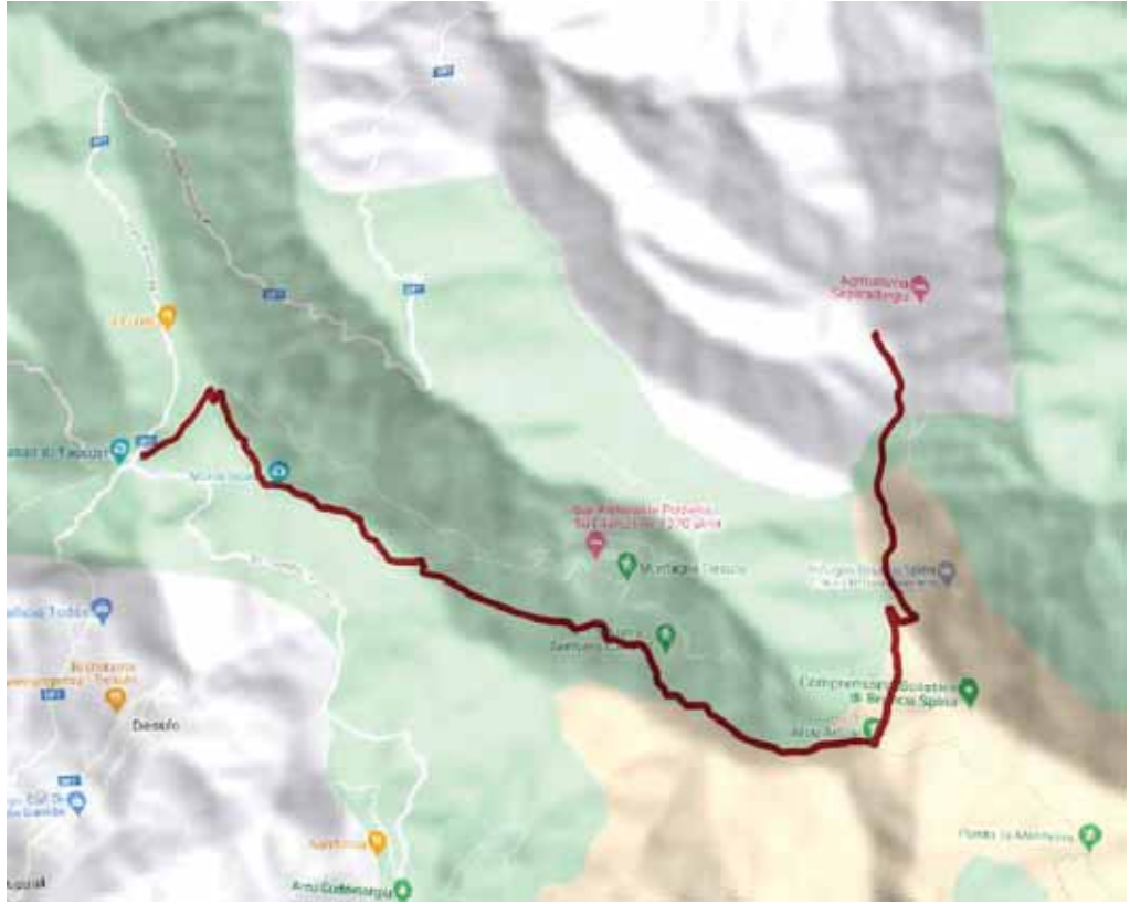
FIG. I - SENTIERO SU MODELLO DI EVALAZIONE DIGITALE