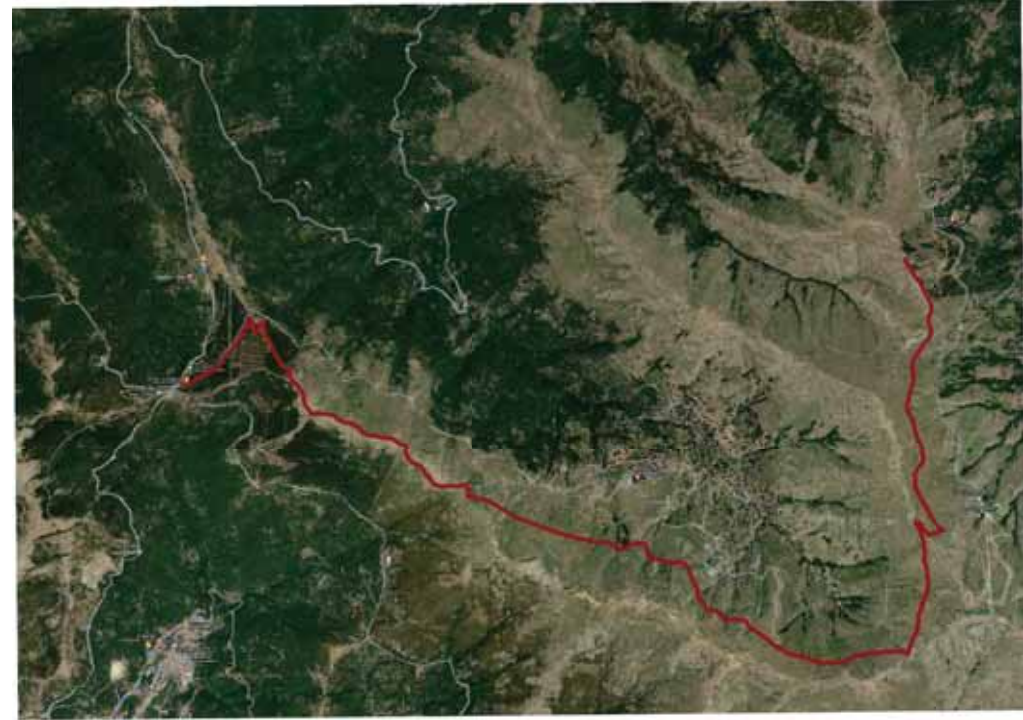
FIG. I - SENTIERO SU STRALCIO GOOGLE EARTH GEOPORTALE REGIONE SARDEGNA