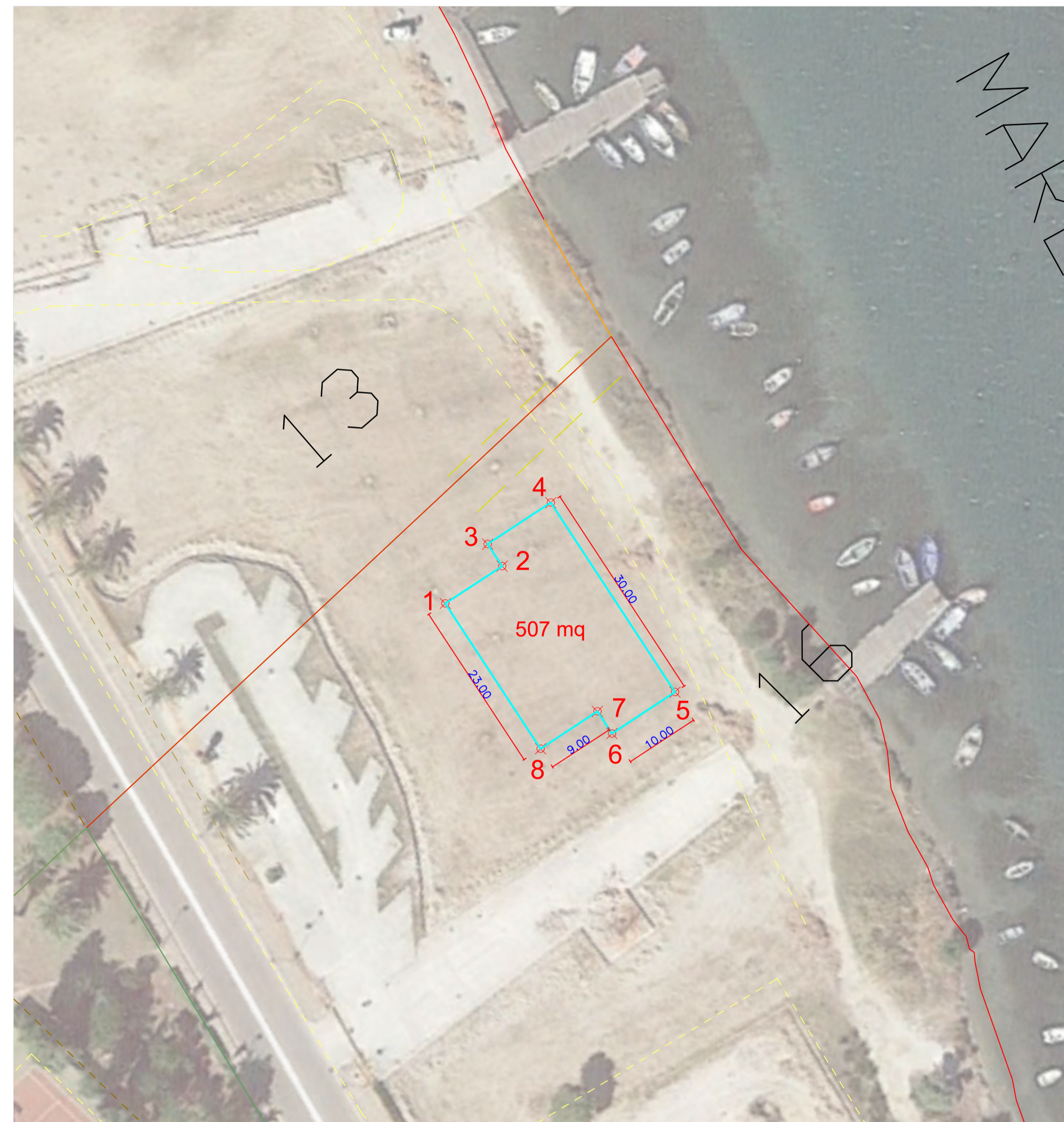
SOVRAPPOSIZIONE CARTOGRAFIA SID SU ORTOFOTO - SCALA 1:500