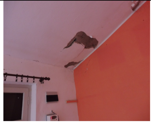
Dettagli del soffitto del Soggiorno