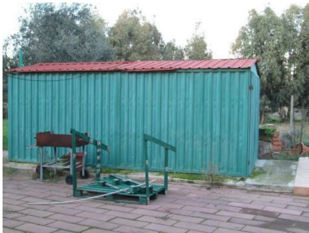
Magazzino attrezzi esterno