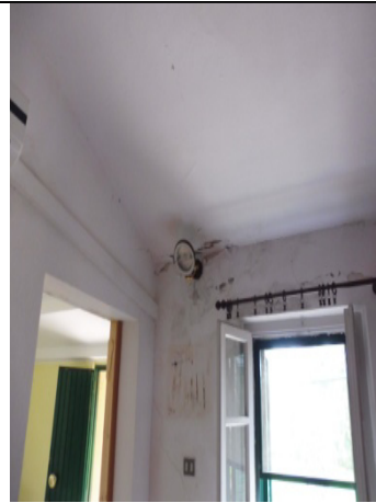
Dettaglio della finestra di una camera singola che si affaccia sull'ingresso