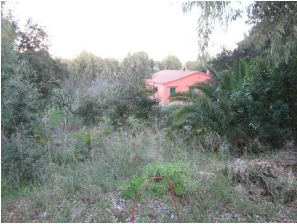
Ingresso dal cancello su strada