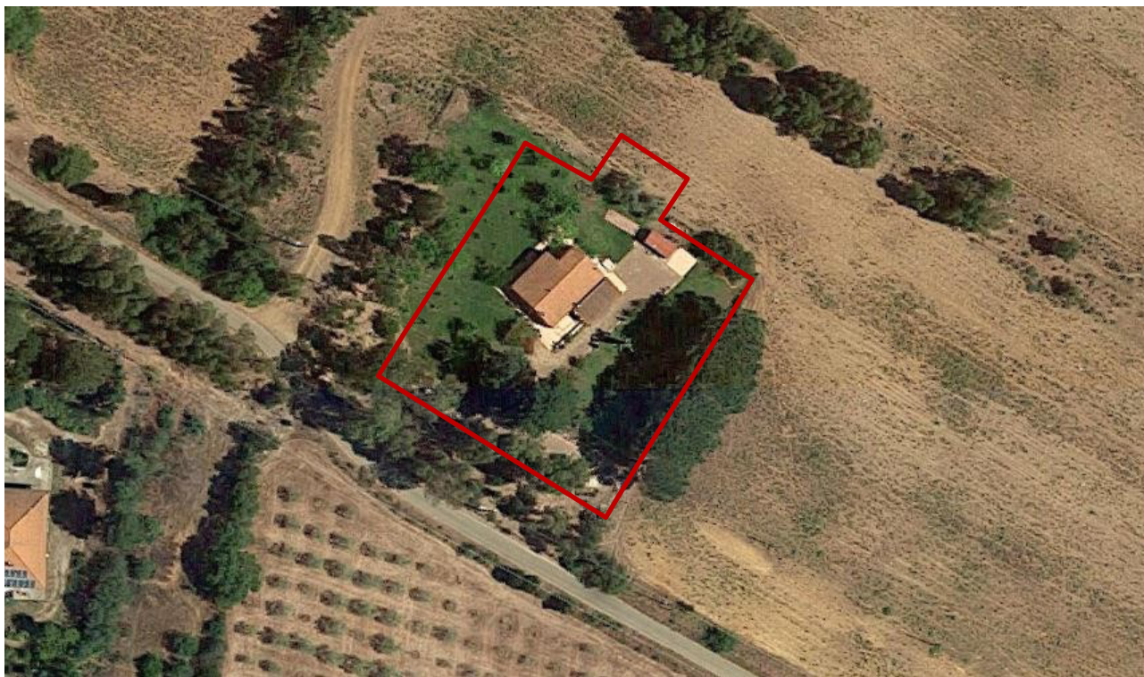
Area di pertinenza dell'immobile.

Sono semplici anche le finiture adottate: intonacata con intonaci di tipo civile e rifinita con pittura superficiale. Le bucatore sono di forma rettangolare (con il lato più corto alla base).