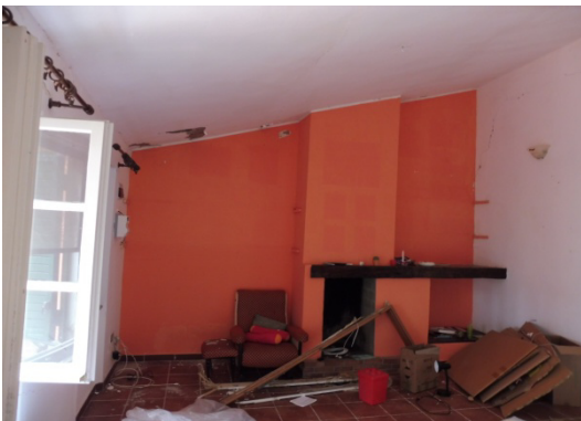
Soggiorno e dettaglio del camino in muratura