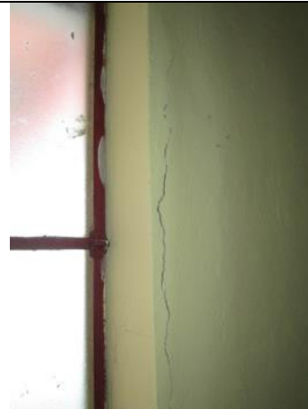
Dettaglio della finestra del ripostiglio