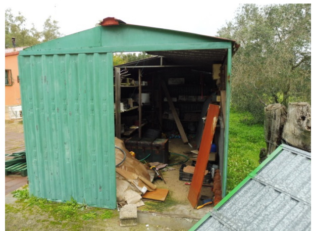
Magazzino attrezzi esterno