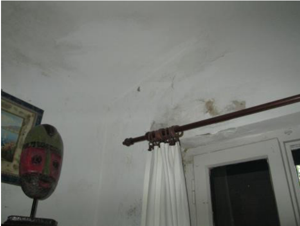
Dettaglio della seconda camera da letto singola (crepe e muffa)