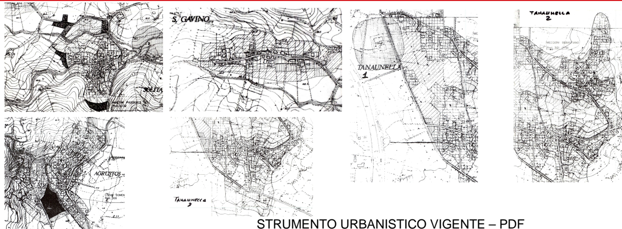
STRUMENTO URBANISTICO VIGENTE – PDF