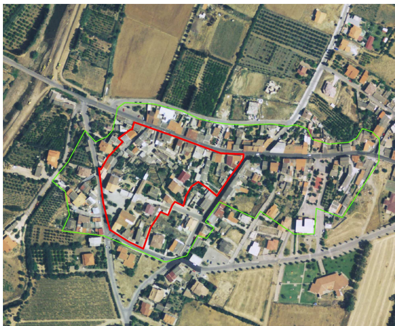
STRUMENTO URBANISTICO VIGENTE – PDF del 1994