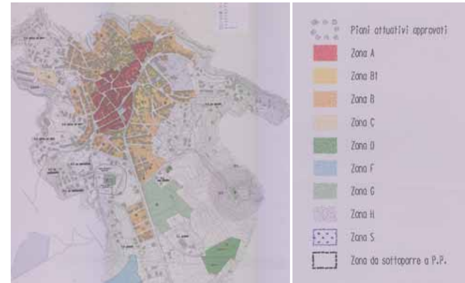
STRUMENTO URBANISTICO VIGENTE – PUC del 1999

Nel PUC del comune di Burcei è presente la zona A. Il Comune di Burcei è dotato di Piano Particolareggiato, approvato con Deliberazione del Consiglio Comunale n° 9 del 10/03/1999