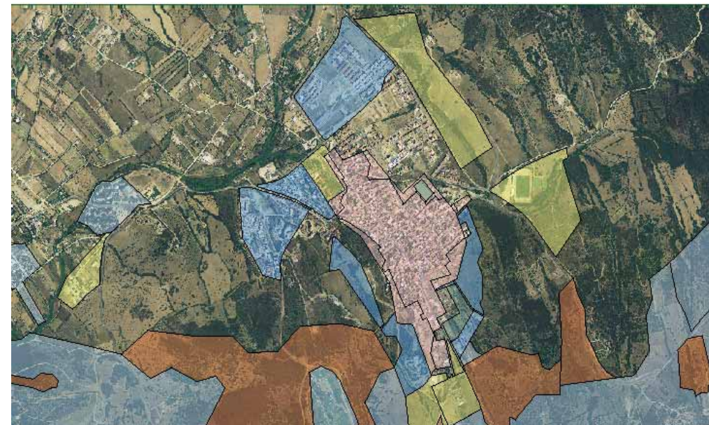
STRUMENTO URBANISTICO VIGENTE – PDF del 1980