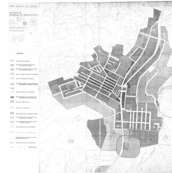
STRUMENTO URBANISTICO VIGENTE – PDF del 1988