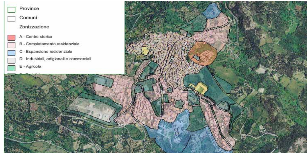
STRUMENTO URBANISTICO VIGENTE – PDF del 1983

Nel PDF del comune di Cuglieri è presente la zona A. Il Comune di Cuglieri non è dotato di Piano Particolareggiato.