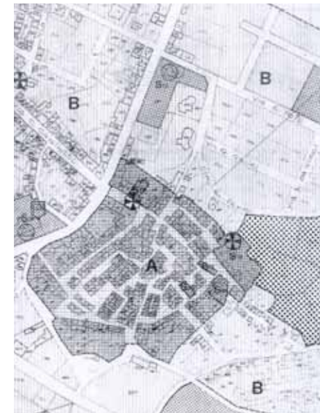
STRUMENTO URBANISTICO VIGENTE – PDF del 1985

Nel PDF del comune di Perfugas è presente la zona A.