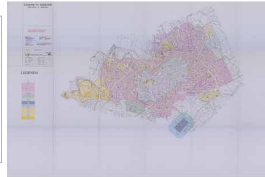
STRUMENTO URBANISTICO VIGENTE – PUC - 2001

Nel PUC di Seneghe è presente la zona A. Il Comune di Seneghe è dotato di Piano Particolareggiato approvato con Deliberazione del Consiglio Comunale n° 16 del 31/03/2006