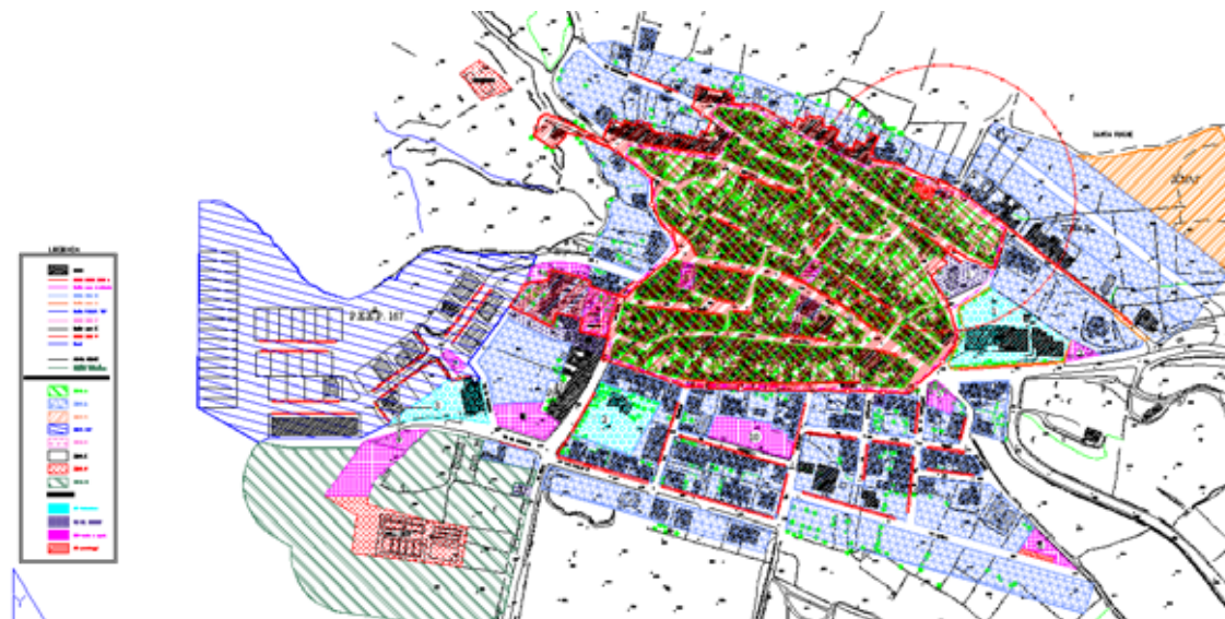
STRUMENTO URBANISTICO VIGENTE – PUC del 2000

Nel PUC del comune di Romana è presente la zona A. Il Comune di Romana è dotato/non è dotato di Piano Particolareggiato, approvato con Deliberazione del Consiglio Comunale n° 12 del 27/04/2005