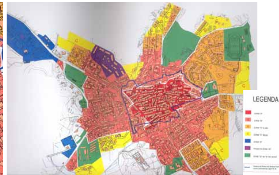
STRUMENTO URBANISTICO VIGENTE – PDF

Nel PDF del comune di Oschiri è presente la zona A. Il Comune di Oschiri è dotato di Piano Particolareggiato, approvato con Deliberazione del Consiglio Comunale n°116 del 21/09/1988