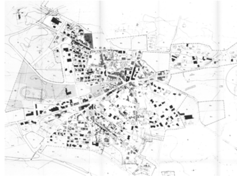
STRUMENTO URBANISTICO VIGENTE – PDF del 1989