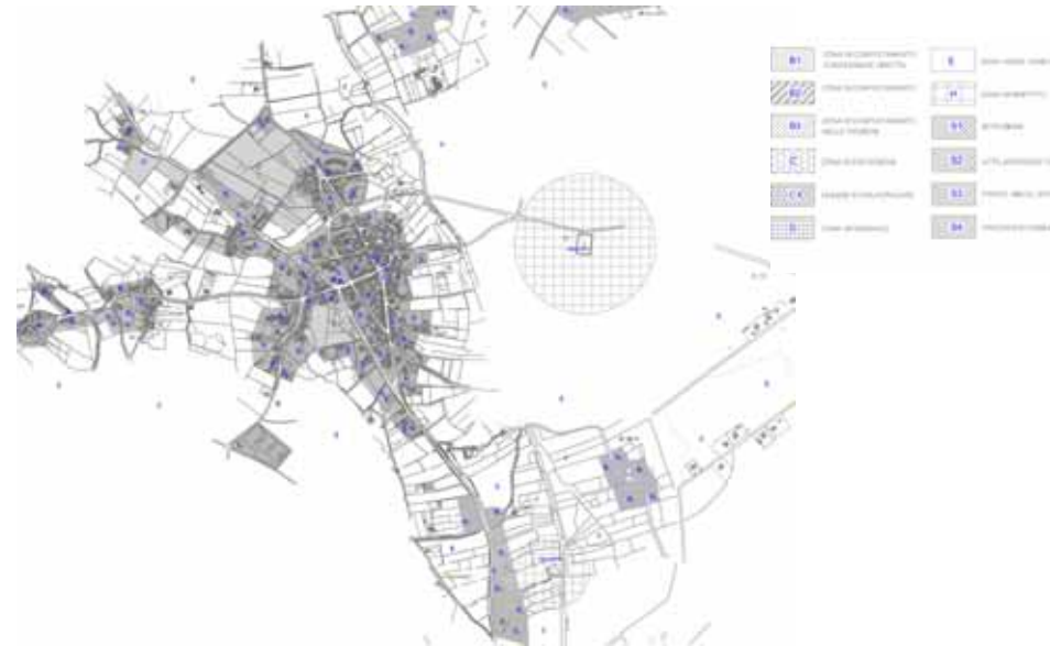
STRUMENTO URBANISTICO VIGENTE – PDF del 1990