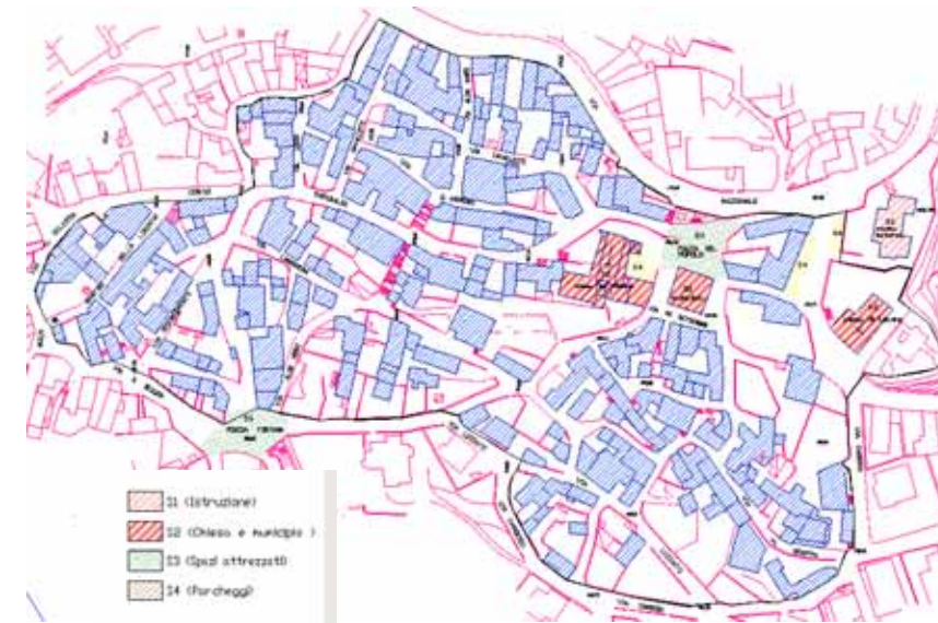
STRUMENTO URBANISTICO VIGENTE – PUC del 2008

Nel PUC del comune di Oniferi è presente la zona A. Il Comune di Oniferi è dotato di Piano Particolareggiato, approvato con Deliberazione del Commissario Prefettizio n° 82 del 31/10/1999