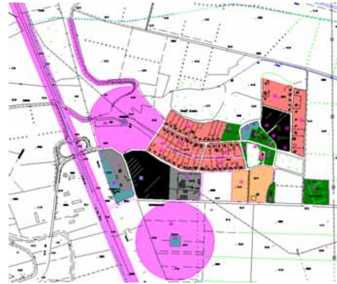
STRUMENTO URBANISTICO VIGENTE – PUC del 2002