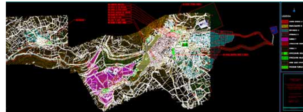
STRUMENTO URBANISTICO VIGENTE – PDF DEL 1985

Nel PDF del comune di Pattada, per la frazione di Bantine è presente la zona A. Bantine è dotato di Piano Particolareggiato, approvato con Deliberazione del Consiglio Comunale n° 3 del 26/01/2001