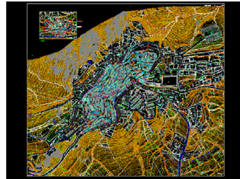
STRUMENTO URBANISTICO VIGENTE – PDF DEL 1986

Nel PDF del comune di Pattada è presente la zona A. Il Comune di Pattada è dotato di Piano Particolareggiato, approvato con Deliberazione del Consiglio Comunale n° 3 del 26/01/2001