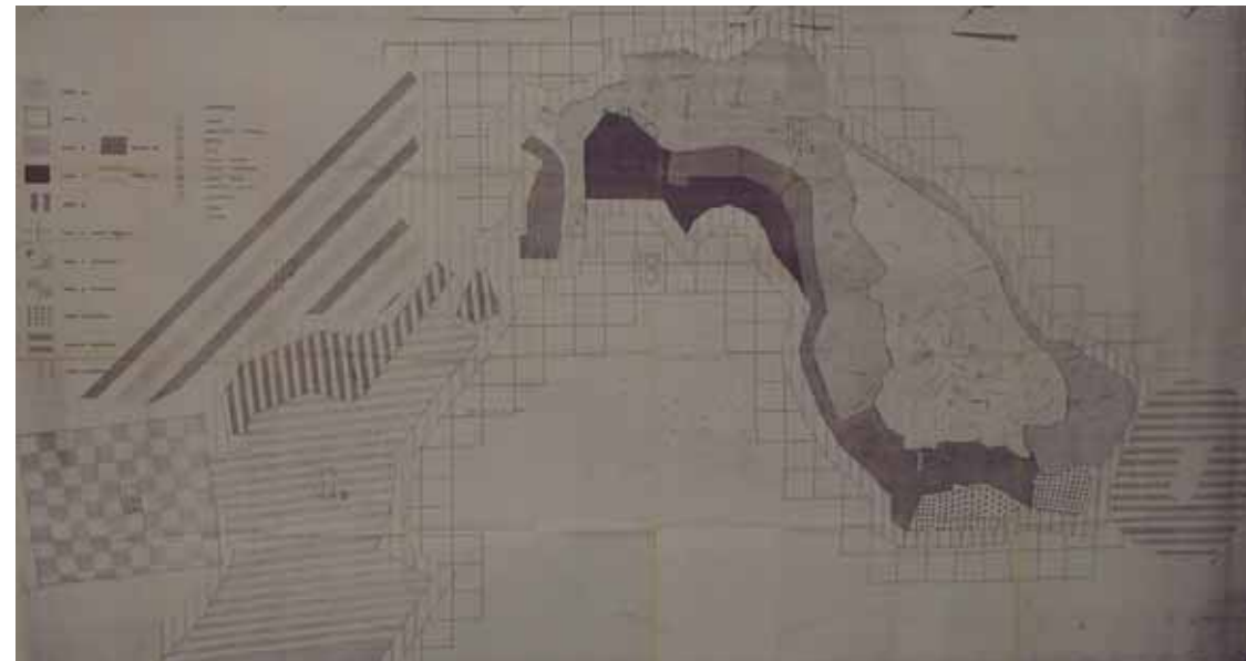
STRUMENTO URBANISTICO VIGENTE – PDF del 1979