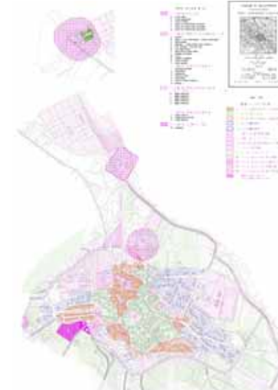
STRUMENTO URBANISTICO VIGENTE – PUC del 2002

Il Comune di Villaurbana è dotato di Piano Particolareggiato approvato con deliberazione C.C. del 17/02/1993