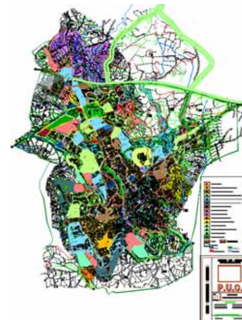
PUC del 2005

Nel Piano Urbanistico Comunale del comune di Oliena è presente la zona A. Il Comune di Oliena è dotato di Piano Particolareggiato approvato con Deliberazione del C.C. n° 32 del 20/11/2001