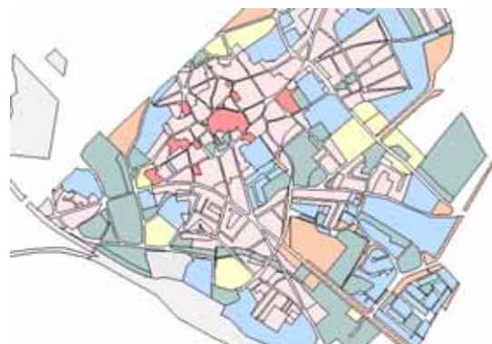
STRUMENTO URBANISTICO VIGENTE PUC del 2001