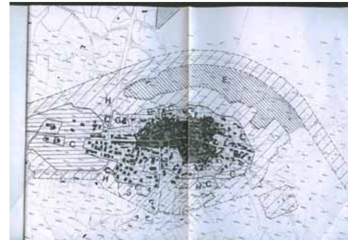
STRUMENTO URBANISTICO VIGENTE – PUC

Nel PUC del comune di Dualchi è presente la zona A. Il Comune di Dualchi è dotato di Piano Particolareggiato approvato con Deliberazione del C.C. n° 11 del 9/06/2003