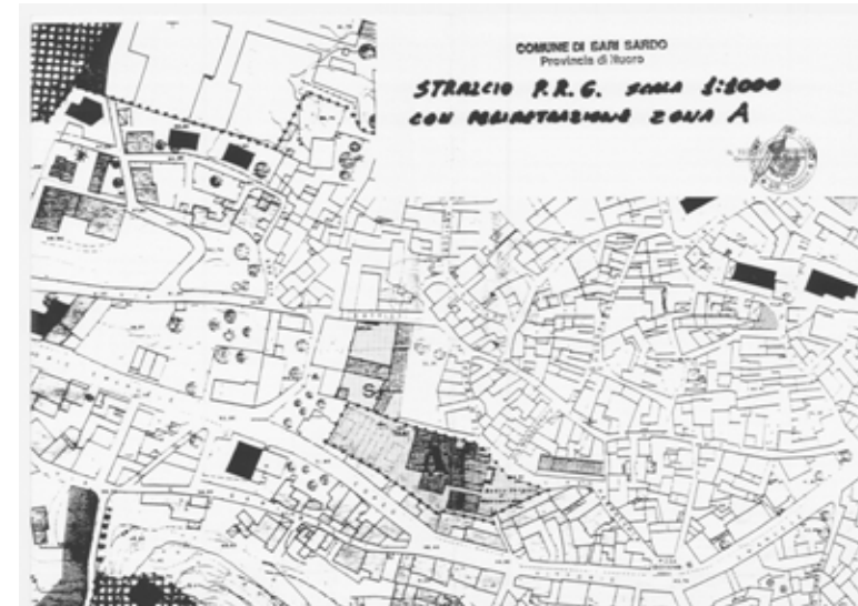
STRUMENTO URBANISTICO VIGENTE – PRG del 1990