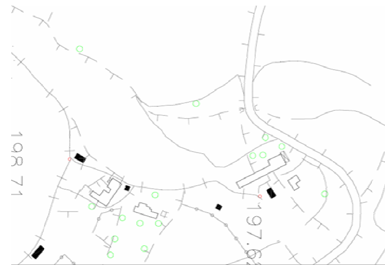
STRUMENTO URBANISTICO VIGENTE – PDF del 1988