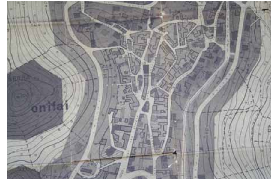
STRUMENTO URBANISTICO VIGENTE – PDF del 1987