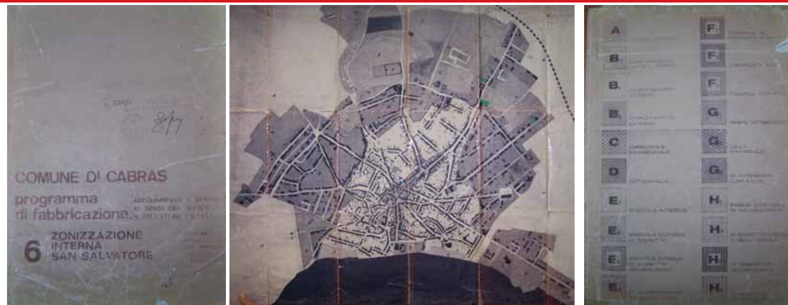
STRUMENTO URBANISTICO VIGENTE – PDF del 1980

Nel PDF del comune di Cabras non è presente la zona A. Il Comune di Cabras non è dotato di Piano Particolareggiato