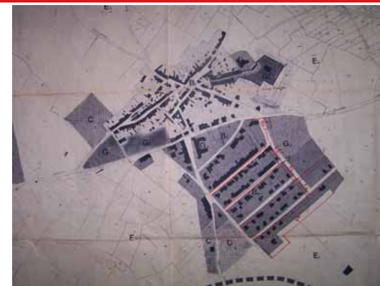
STRUMENTO URBANISTICO VIGENTE – PDF del 1980