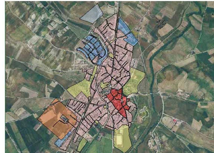
STRUMENTO URBANISTICO VIGENTE – PUC del 2002