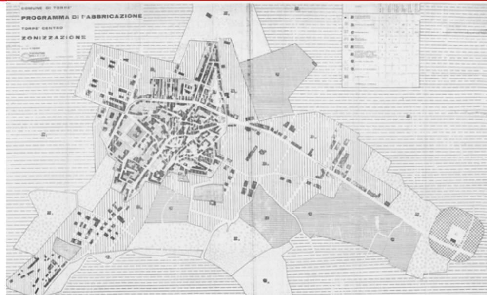
STRUMENTO URBANISTICO VIGENTE – PDF del 1977

Nel PDF del comune di Torpè non è presente la zona A. Il Comune di Torpè non è dotato di Piano Particolareggiato.