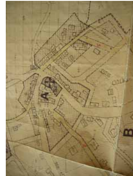
STRUMENTO URBANISTICO VIGENTE – PDF del 1985

Nel PDF del comune di Erula è presente la zona A. Il Comune di Erula è dotato di Piano Particolareggiato, approvato con Decreto assessoriale n°1134/U del 13/07/1987