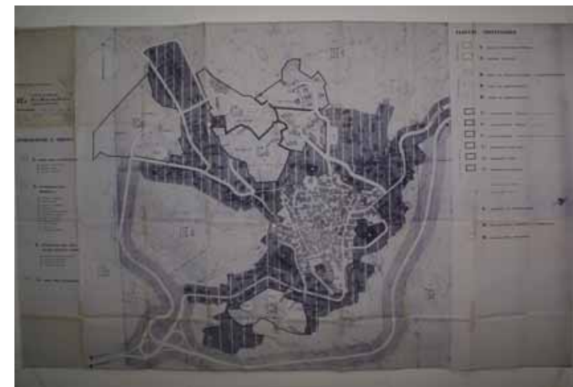
STRUMENTO URBANISTICO VIGENTE – PRG del 1987

Nel PRG del comune di Orotelli è presente la zona A. Il Comune di Orotelli è dotato di Piano Particolareggiato, approvato con Deliberazione del Consiglio Comunale n° 11 del 13/02/1997