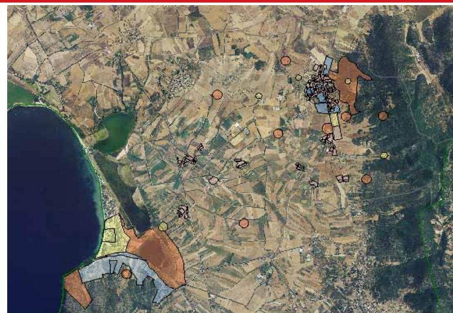
STRUMENTO URBANISTICO VIGENTE – PUC del 1991