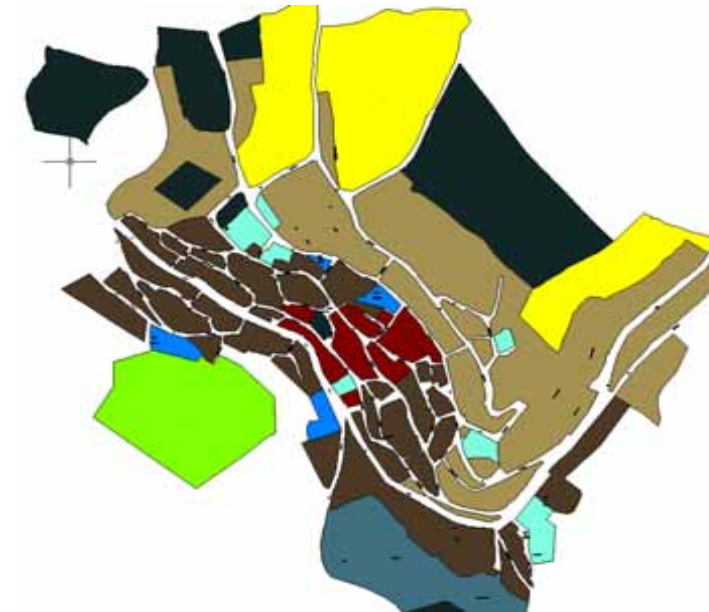
STRUMENTO URBANISTICO VIGENTE – PDF del 1983

Nel PDF del comune di Seulo è presente la zona A. Il Comune di Seulo è dotato di Piano Particolareggiato approvato con Deliberazione del Consiglio Comunale n° 70 del 28/12/1999