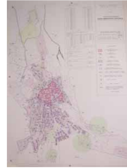
STRUMENTO URBANISTICO VIGENTE – PUC del 2005

Nel PUC del comune di Perdasdefogu è presente la zona A. Il Comune di Perdasdefogu è dotato di Piano Particolareggiato approvato con Deliberazione del Consiglio Comunale n° 85 del 27/08/2007