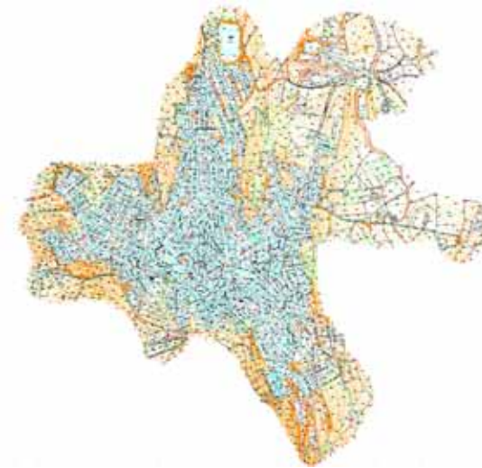
STRUMENTO URBANISTICO VIGENTE – PDF DEL 1987