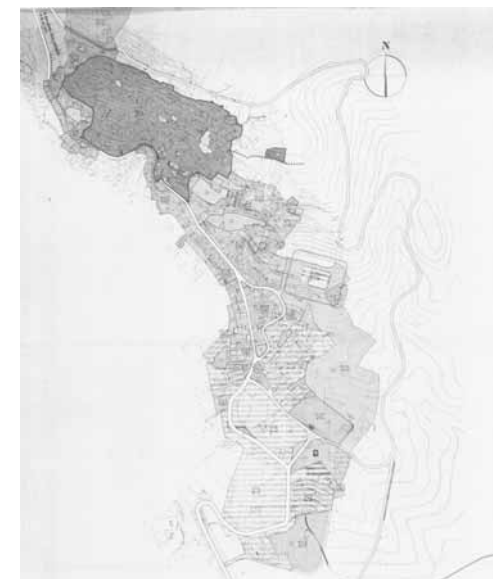
STRUMENTO URBANISTICO VIGENTE – PUC DEL 1995