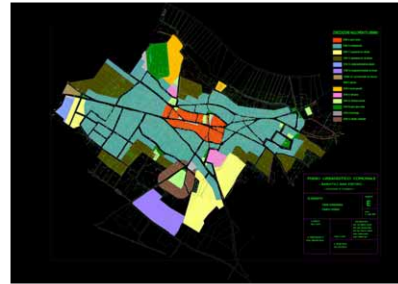
STRUMENTO URBANISTICO VIGENTE – PUC del 2005

Nel PUC del comune di Baratili San Pietro è presente la zona A. Il Comune di Baratili San Pietro è dotato di Piano Particolareggiato approvato con decreto dell'Assessorato all'Urbanistica della Regione Sardegna n°1515/U del 10/10/1987