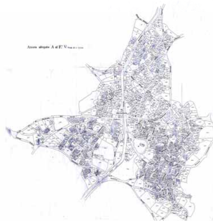
Atzara, abitato A al P.C. V. scala 1:10.000

Centro di antica e prima formazione del P.P.R. – verifica del perimetro del centro di antica e prima formazione a scala comunale – perimetro del centro storico nello strumento urbanistico vigente