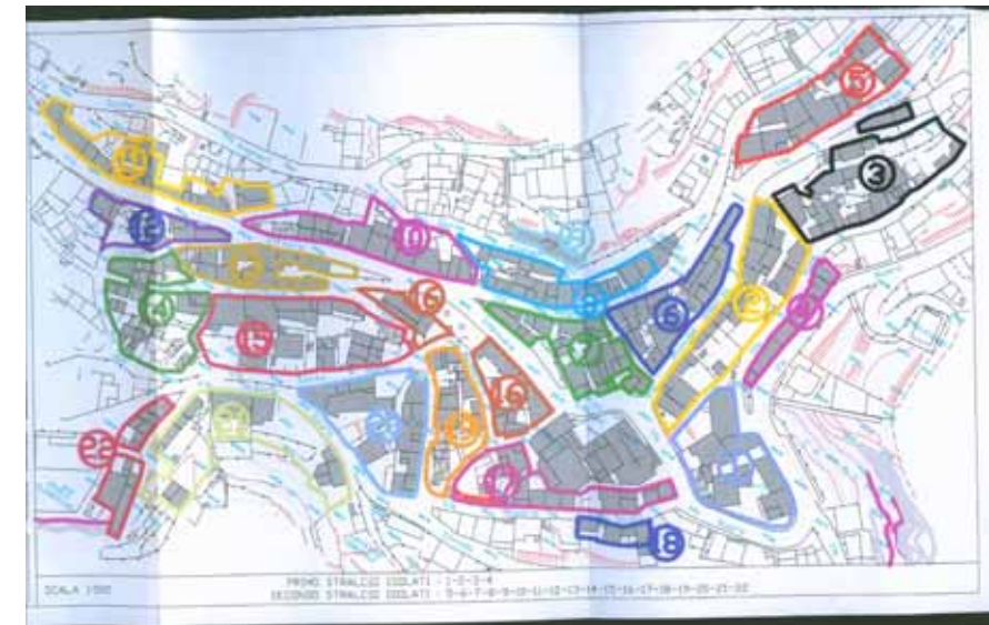
STRUMENTO URBANISTICO VIGENTE – PUC del 2001

Nel PUC del comune di Talana è presente la zona A. Il comune di Talana è dotato di Piano Particolareggiato approvato con Deliberazioni del Consiglio Comunale nn° 27 del 28/05/2002 e 44 del 11/11/2004