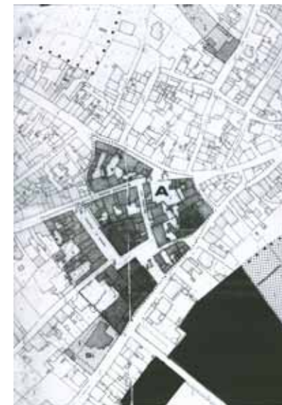
STRUMENTO URBANISTICO VIGENTE – PUC DEL 1993