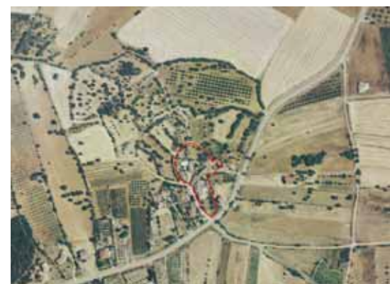
Barrua de Susu

Nel PUC del comune di Santadi, per le frazioni di Barrua de Susu, Su Benatzu e Is Cattas, è presente la zona A. Il Comune di Santadi, per le frazioni di Su Benatzu e Is Cattas, è dotato di Piani Particolareggiati approvati con Deliberazione del Consiglio Comunale n° 29 del 18/11/2003