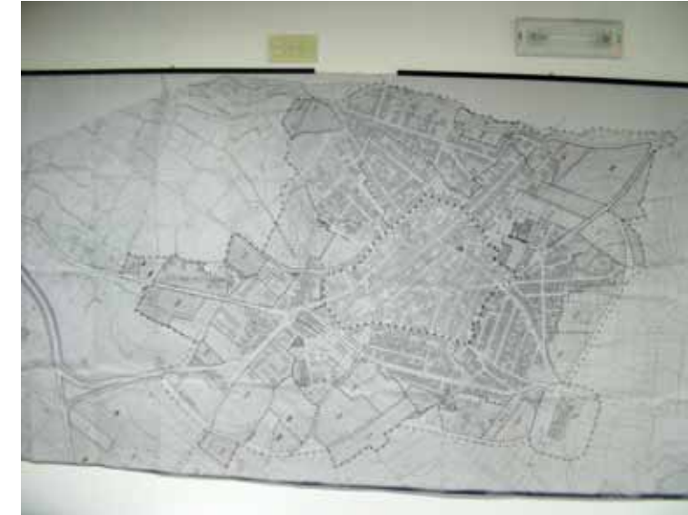
STRUMENTO URBANISTICO VIGENTE – PUC del 2000

Nel PUC del comune di Usini è presente la zona A.