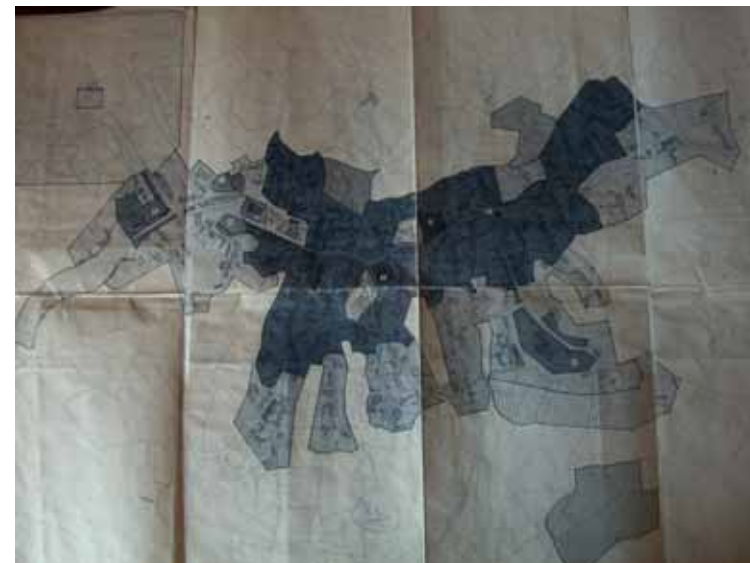
STRUMENTO URBANISTICO VIGENTE – PDF del 1984