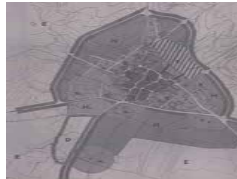
STRUMENTO URBANISTICO VIGENTE – PUC