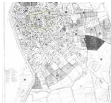
STRUMENTO URBANISTICO VIGENTE – PUC del 1995