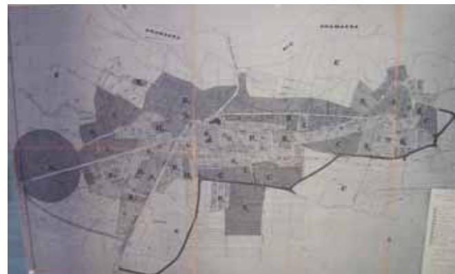
STRUMENTO URBANISTICO VIGENTE – PRG del 1985