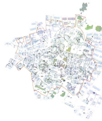
STRUMENTO URBANISTICO VIGENTE – PUC del 1997

Nel PUC del comune di Senis è presente la zona A. Il Comune di Senis è dotato di Piano Particolareggiato, approvato con Deliberazione del Consiglio Comunale n°79 del 19/12/2008